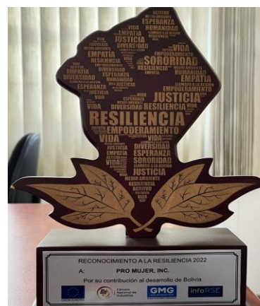
Reconocimiento a la resiliencia 2022 – Proyecto prevención y atención a mujeres en situación de violencia #MujerSegura

Asimismo en la gestión 2021, las Naciones Unidas, Pacto Global y la Confederación de Empresarios Privados de Bolivia (CEPB) le otorgaron el reconocimiento a las buenas prácticas de desarrollo sostenible por los servicios y apoyo a mujeres en situación de violencia a través del proyecto #MujerSegura.