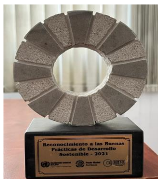
Reconocimiento a las buenas prácticas de desarrollo sostenible 2022 – Proyecto prevención y atención a mujeres en situación de violencia #MujerSegura

Asimismo en la gestión 2021, las Naciones Unidas, Pacto Global y la Confederación de Empresarios Privados de Bolivia (CEPB) le otorgaron el reconocimiento a las buenas prácticas de desarrollo sostenible por los servicios y apoyo a mujeres en situación de violencia a través del proyecto #MujerSegura.