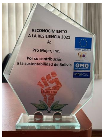
Reconocimiento a la resiliencia 2021 – Proyecto de promotoras de salud comunitarias